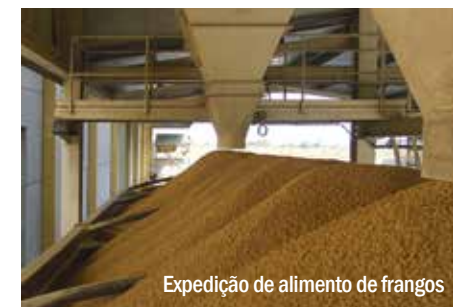
Expedição de alimento de frangos