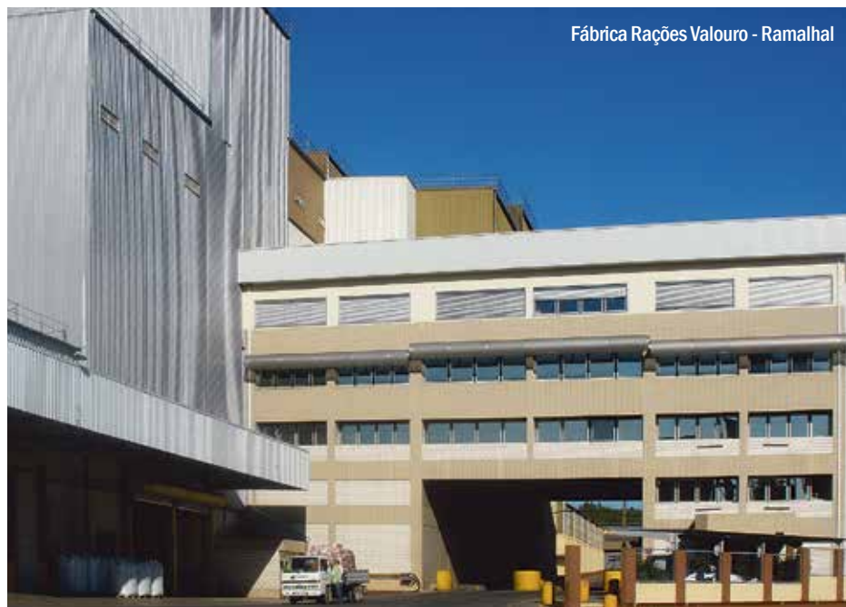
Fábrica Rações Valouro - Ramalhal

“EM 31 DE DEZEMBRO DE 2015 O NÚMERO DE TRABALHADORES DIRETOS DO GRUPO VALOURO ERA DE 2026, E O VALOR DE FATURAÇÃO, EM 2015 ASCENDEU A 274 MILHÕES DE EUROS, SENDO QUE AS EXPORTAÇÕES REPRESENTAM 13% DESSE VALOR”