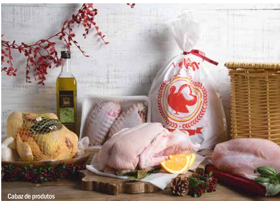
Cabaz de produtos