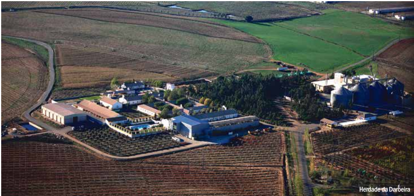
Herdade da Darbeira