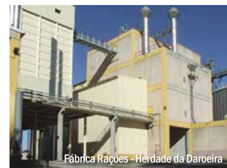
Fábrica Rações - Herdade da Daroeira