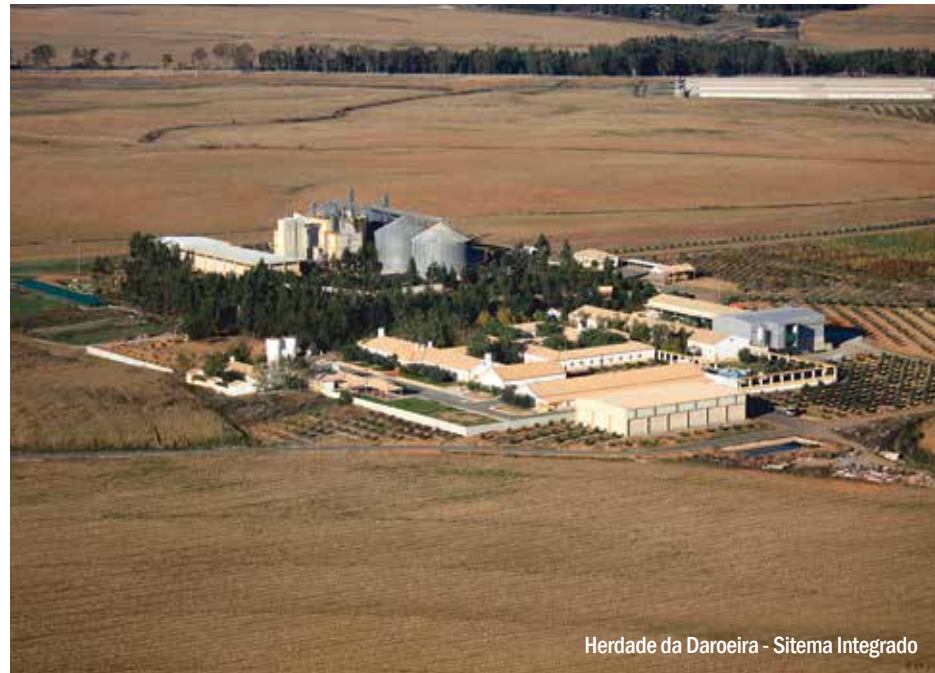
Herdade da Daroeira - Sistema Integrado

em Torres Vedras, servido por caminho de ferro, o que lhe veio proporcionar uma competitividade no caminho das rações. As rações Valouro têm soluções nutricionais para a alimentação animal no fabrico e comercialização de pré-misturas e alimentos compostos para frangos, frango do campo, perus, patos, codornizes, gali-