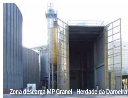
Zona descarga MP Granel - Herdade da Daroeira