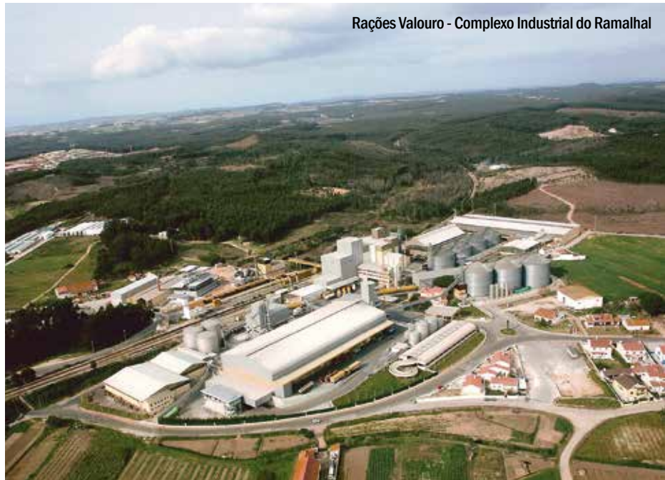
Rações Valouro - Complexo Industrial do Ramalhal